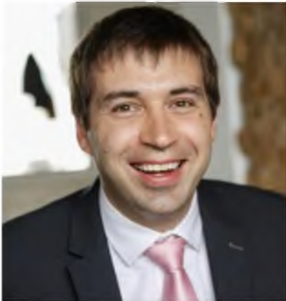
ФОТО ДЕЛЕГОВАНОГО ПРЕДСТАВНИКА БЛАГОДІЙНОЇ ОРГАНІЗАЦІЇ БЛАГОДІЙНИЙ ФОНД "УКРАЇНА КОСМІЧНА"

Ініціативній групі з підготовки установчих зборів по формуванню нового складу Громадської ради при Святошинській районній в м. Києві державній адміністрації