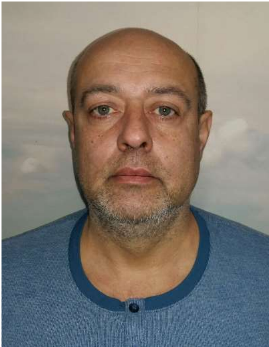
ФОТО ДЕЛЕГОВАНОГО ПРЕДСТАВНИКА ГО «ФЕДЕРАЦІЯ ПОЛ ДЕНСУ УКРАЇНИ»

Ініціативній групі з підготовки установчих зборів по формуванню нового складу Громадської ради при Святошинській районній в м. Києві державній адміністрації