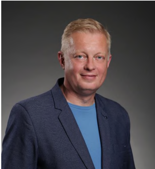
ФОТО ДЕЛЕГОВАНОГО ПРЕДСТАВНИКА БО «ШЛЯХ ДО МАЙБУТНЬОГО»

Ініціативній групі з підготовки установчих зборів по формуванню нового складу Громадської ради при Святошинській районній в м. Києві державній адміністрації