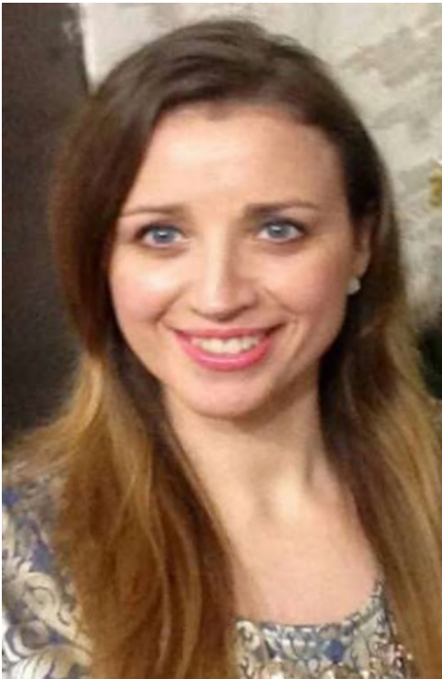
ФОТО ДЕЛЕГОВАНОГО ПРЕДСТАВНИКА БО «ШЛЯХ ДО МАЙБУТНЬОГО»

Ініціативній групі з підготовки установчих зборів по формуванню нового складу Громадської ради при Святошинській районній в м. Києві державній адміністрації