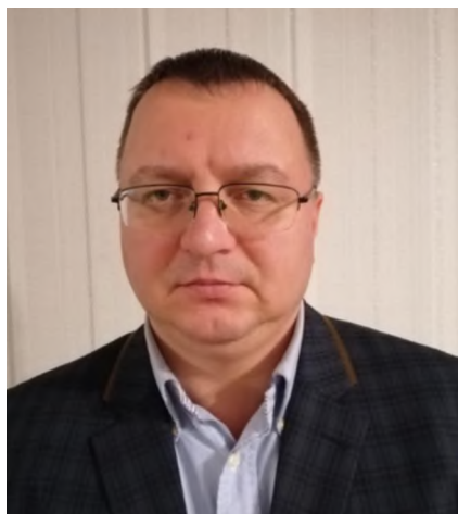
ФОТО ДЕЛЕГОВАНОГО ПРЕДСТАВНИКА ГРОМАДСЬКОЇ ОРГАНІЗАЦІЇ «ОРГАНІЗАЦІЯ З ЗАХИСТУ ПРАВ ОШУКАНИХ ВКЛАДНИКІВ БАНКУ «ІНТЕГРАЛ-БАНК»