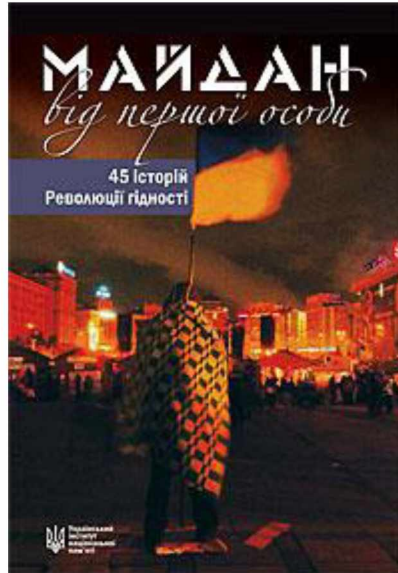
«Майдан від першої особи. 45 історій Революції Гідності»